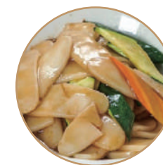
176. GNOCCHI DI RISO CON VERDURE