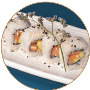
80.SAVOCADO ROLL Salmone,avocado,sesamo