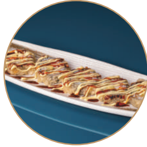
77.FUTOMAKI CALIFORNIA FRITTO Surimi*,avocado,cetriolo,maionese,teriyaki