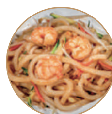
173. YAKI UDON CON GAMBERI Gamberi*, verdure, uova