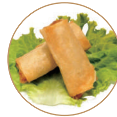
151. INVOLTINI PRIMAVERA 2pz Sfoglia di riso e verdure miste