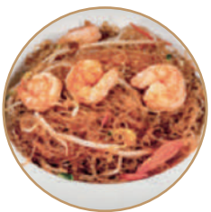
171. SPAGHETTI DI SOIA CON GAMBERI Gamberi*, verdure e soia