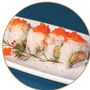
81.SAVOCADO EBITOBICO Salmone,avocado, grambero* crudo,tobiko