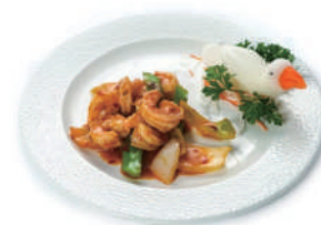
202.GAMBERI PICCANTE Peperoni, cipolla