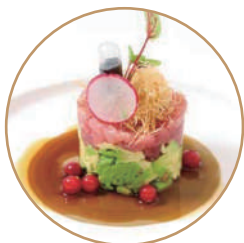
T02. TARTARE TONNO AVOCADO Condito con salsa wasabi e kadaifi (massimo 1 porzione)