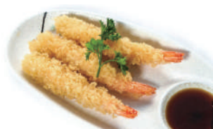
182. TEMPURA DI GAMBERI (massimo 1 porzione)