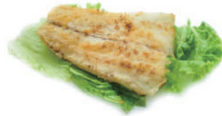
187. BRANZINO ALLA GRIGLIA (massimo 2 porzione)