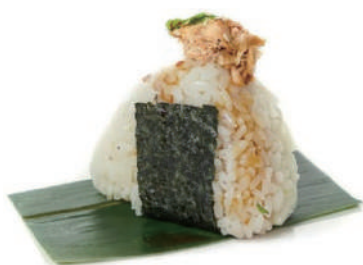
33. ONIGIRI MIURA Salmone cotto, philadelphi e sesamo