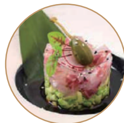
T03. TARTARE BRANZINO AVOCADO Condito con salsa passion fruit e kadaifi (massimo 1 porzione)