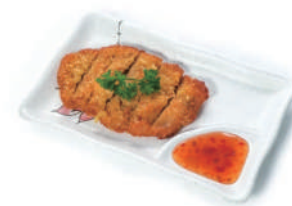
184. COTOLETTA DI POLLO