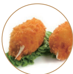
154. CHELE DI GRANCHIO* 2pz