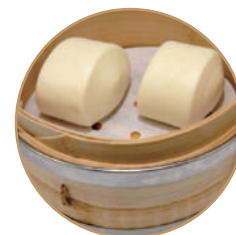
148. PANE AL VAPORE 2pz Pane orientale al vapore