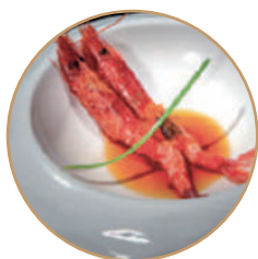
K05. GAMBERI ROSSI Gamberi* rossi e tobiko* (massimo 1 porzione)