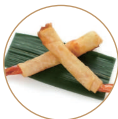
153. INVOLTINI DI GAMBERI* Sfoglia di riso e gamberi