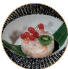
K07. TARTARE AMAEBI Tartare di gamberi* dolci, tobiko e olio di oliva (massimo 1 porzione)