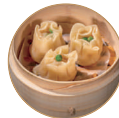
142. RAVIOLI SHAOMAI 3pz Ripieno di gamberini e carne