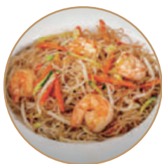
169. SPAGHETTI DI RISO CON GAMBERI Gamberi*, verdure e uova