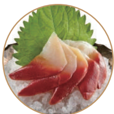
k10. Hokkigai Vongole artiche (massimo 1 porzione)