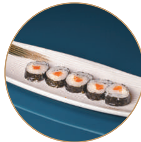
78.FUTOMAKI SAKE PHILA Salmone e philadelphia