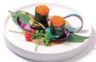
57. GUNKAN TOBIKO (massimo 1 porzione)