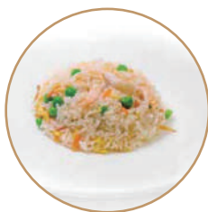
162. RISO CON GAMBERI Gamberi*, verdure e uova