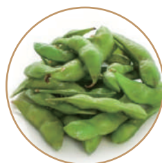
150. EDAMAME* Baccelli di soia