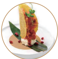
K12. TACOS TONNO Tonno, avocado, philadelphia, spicymaio (massimo 1 porzione)