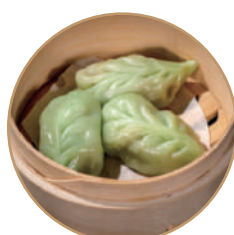
144. RAVIOLI VEGETARIANO 3pz Ripieno di verdure