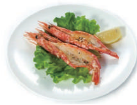
189. GAMBERONI ALLA GRIGLIA (massimo 2 porzione)