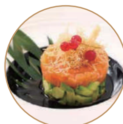
T01. TARTARE SALMONE AVOCADO Condito con salsa mango e kadaifi (massimo 1 porzione)