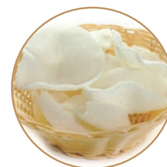
156. NUVOLETTE DI GAMBERI Chips di gamberi