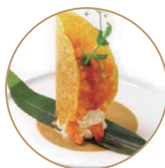
K08. TACOS SALMONE salmone, avocado, philadelphia, spicymaio (massimo 1 porzione)