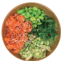
118. POKE SALMONE Base di riso, salmone crudo, avocado, edamame, wakame, sesamo e salsa poke