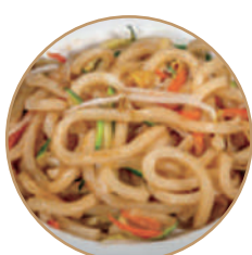
172. YAKI UDON CON VERDURE Verdure, uova