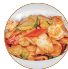
175. GNOCCHI DI RISO CON GAMBERI Gamberi*, verdure