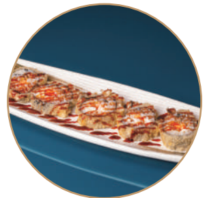
79.FUTOMAKI SAKE PHILA FRITTO Salmone,philadelphia,teriyaki