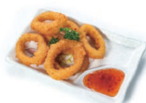
183. CALAMARI FRITTI