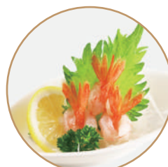
K11. Gamberi Amaebi (massimo 1 porzione)