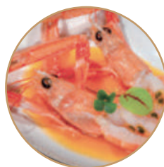
K06. SCAMPI TROPICAL Scampi* crudi con salsa passion fruit (massimo 1 porzione)