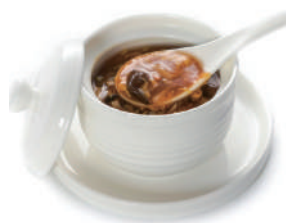
136. ZUPPA AGRO-PICCANTE Bambu, funghi, tofu, uova e salsa agro-piccante