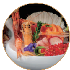
K02. CRUDITE MIX Sashimi mix, gamberi* rossi e scampi* (massimo 1 porzione)