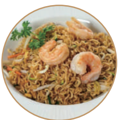
174. RAMEN SALTATI Gamberi*, verdure e salsa piccante