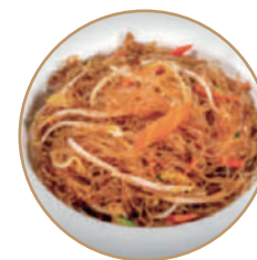
170. SPAGHETTI DI SOIA CON VERDURE Verdure e soia