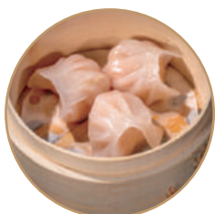
143. RAVIOLI CRISTALLO 3pz Ripieno di gamberi