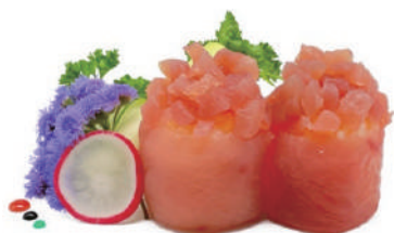
53. GUNKAN TONNO (massimo 1 porzione)