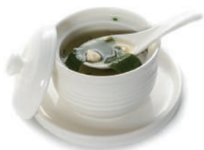
135. ZUPPA DI MISO Pasta di miso, alghe, tofu