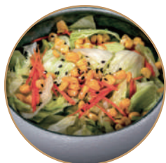
130. INSALATA MISTA Condito con salsa di sesamo