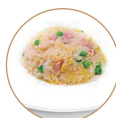
163. RISO ALLA CANTONESE Prosciutto cotto*, verdure e uova