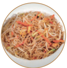
168. SPAGHETTI DI RISO CON VERDURE Verdure e uova