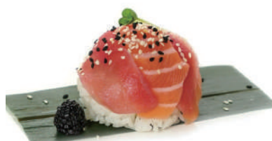
32. CHIRASHI TONNO Riso con tonno e sesamo