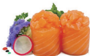
51. GUNKAN SALMONE (massimo 1 porzione)