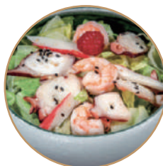
132. INSALATA DI GAMBERI Condito con salsa soiasalad