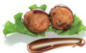
157. POLPETTE DI POLPO Salsa teriyaki