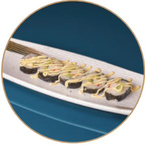
76.FUTOMAKI CALIFORNIA Surimi*, avocado, cetriolo, maiones