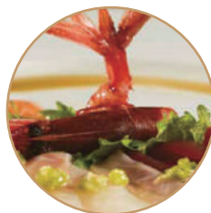
K03. CARPACCIO SPECIAL Carpaccio salmone, tonno,branzino e gambero* rosso con salsa wasabi (massimo 1 porzione)