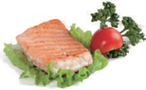
186. SALMONE ALLA GRIGLIA (massimo 2 porzione)