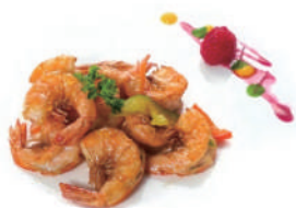
200.GAMBERI SALE PEPE Peperoni, cipolla