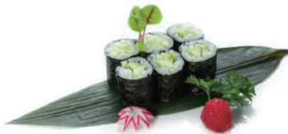
63. HOSOMAKI CETRIOLO