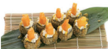
65. HOSOMAKI MANGO Fritto con salmone, philadelphia, mango, teriyaki