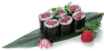
61. HOSOMAKI TONNO