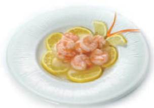
203.GAMBERI AL LIMONE