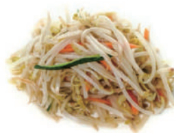
209. GERMOGLI DI SOIA