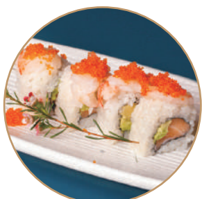
81.SAVOCADO EBITOBICO Salmone,avocado, grambero* crudo,tobiko