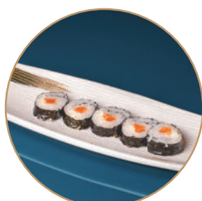
78.FUTOMAKI SAKE PHILA Salmone e philadelphia