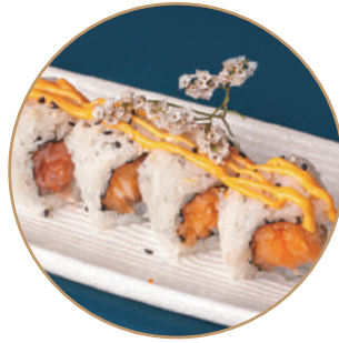
106.SPICY SALMON Salmone,sesamo,spicymaio