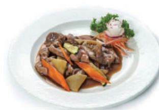
214. MANZO CON VERDURE