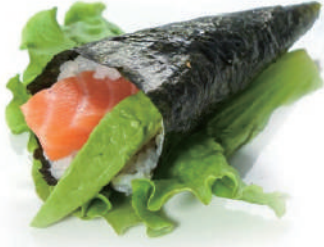
70.TEMAKI SALMONE AVOCADO