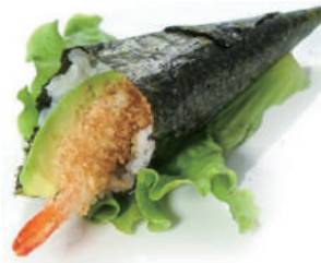
75.TEMAKI EBITEN Gambero fritto, avocado, teriyaki