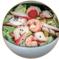
132. INSALATA DI GAMBERI Condito con salsa soiasalad