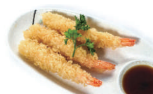
182. TEMPURA DI GAMBERI (massimo 1 porzione)