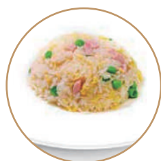
163. RISO ALLA CANTONESE Prosciutto cotto*, verdure e uova