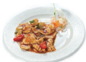
198. POLLO AL PICCANTE Peperoni, cipolla, piccante