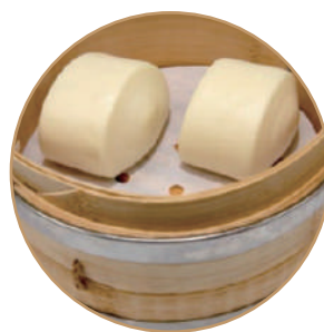
148. PANE AL VAPORE 2pz Pane orientale al vapore