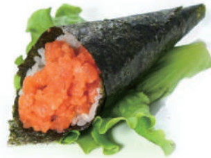
73.TEMAKI SPICY SALMON Tartare salmone,spicymaio