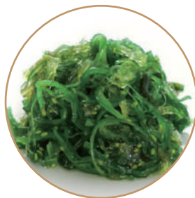
134. GOMA WAKAME Alga giapponese in salsa dolce-piccante