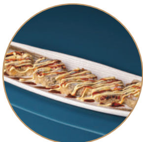
77.FUTOMAKI CALIFORNIA FRITTO Surimi*,avocado,cetriolo,maionese,teriyaki