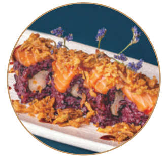
111.EBITEN NERA SALMONE Gamberi* fritti,salmone, cipolla fritta,teriyaki