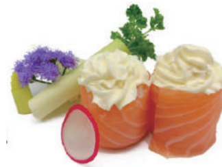
52. GUNKAN SALMONE PHILADEPHIA (massimo 1 porzione)