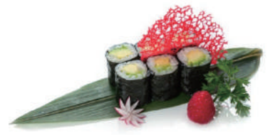
62. HOSOMAKI AVOCADO