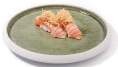
48. NIGIRI SALMONE SCOTTATO Maionese, salsa teriyaki e kadaifi