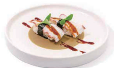
47. NIGIRI POLPO Salsa teriyaki