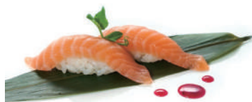
40. NIGIRI SALMONE