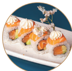
82.SAVOCADO PHILA Salmone,avocado,philadelphia