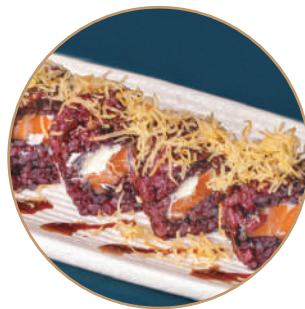
113.SAPHI NERA Salmone,philadelphia, granelle patate, teriyaki