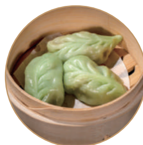
144. RAVIOLI VEGETARIANO 3pz Ripieno di verdure