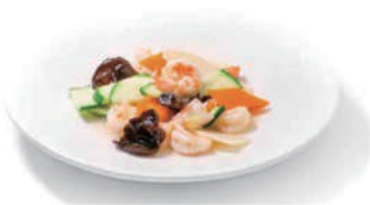
201.GAMBERI CON VERDURE