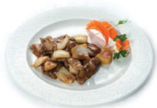
205. MANZO CON CIPOLLA