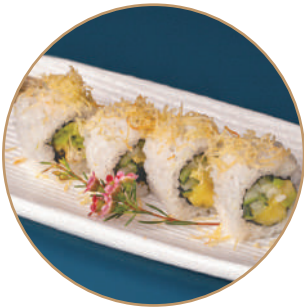
89.VEGETALE MANGO Mango,cetriolo,avocado, granelle patate