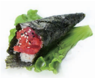
74.TEMAKI SPICY TUNA Tartare tonno,spicymaio