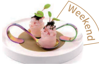
54. GUNKAN BRANZINO (massimo 1 porzione)