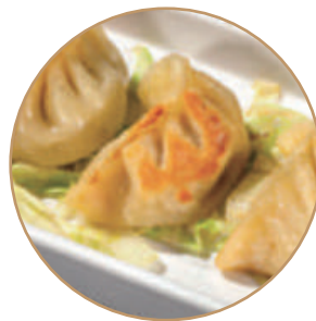
141. RAVIOLI ALLA GRIGIA 3pz Ripieno di carne e verdure