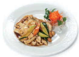
194. POLLO ALLE MANDORLE Bambu,carote,soia,mandorle