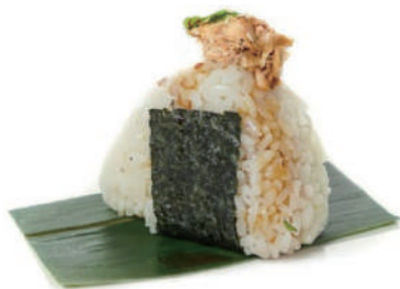
33. ONIGIRI MIURA Salmone cotto, philadelphi e sesamo