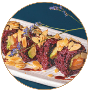
112.SAVODADO NERA MANDORLE Salmone,avocado, mandorle,teriyaki