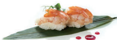
43. NIGIRI GAMBERO CRUDO