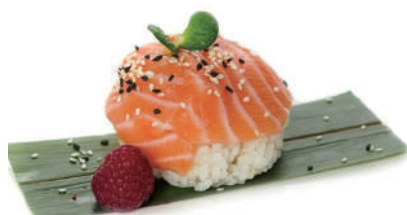
31. CHIRASHI SALMONE Riso con salmone e sesamo