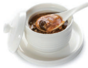
136. ZUPPA AGRO-PICCANTE Bambu, funghi, tofu, uova e salsa agro-piccante