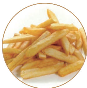
155. PATATINE FRITTE*