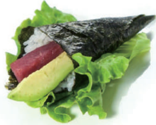
71.TEMAKI TONNO AVOCADO