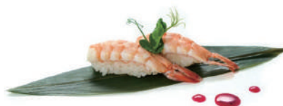
44. NIGIRI GAMBERO COTTO