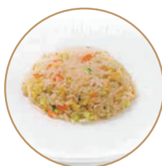
164. RISO CON VERDURE Verdure e uova