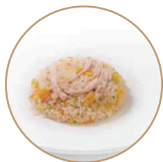
161. RISO CON POLLO Riso saltato con pollo*, verdure e uova