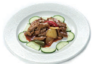
213. MANZO AL PICCANTE Peperoni e cipolla