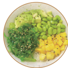
120. POKE VEGETARIANO Base di riso, mango, avocado, edamame, wakame, sesamo e salsa poke