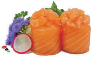
51. GUNKAN SALMONE (massimo 1 porzione)