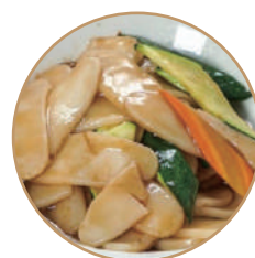
176. GNOCCHI DI RISO CON VERDURE