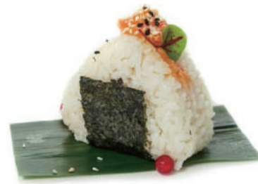
35. ONIGIRI SALMONE CRUDO Salmone crudo e tobiko