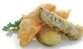
181. TEMPURA DI VERDURE