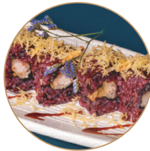
110.EBITEN NERA Gamberi* fritti, granelle patate,teriyaki