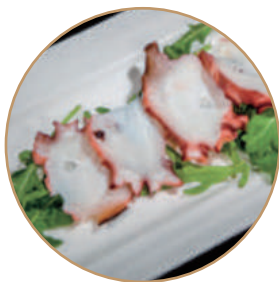
124. POLPO E RUCOLA Carpaccio di polpo, rucola, salsa ponzu e sesamo (massimo 1 porzione)