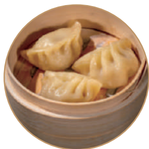
140. RAVIOLI DI CARNE 3pz Ripieno di carne e verdure