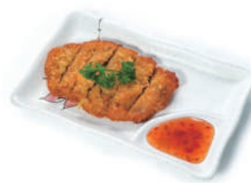
184. COTOLETTA DI POLLO