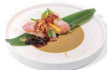
50. NIGIRI TONNO SCOTTATO Maionese, salsa teriyaki e kadaifi