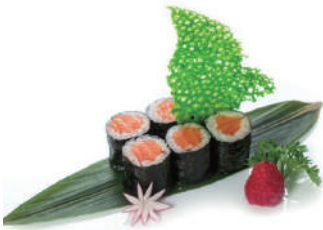
60. HOSOMAKI SALMONE