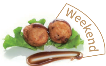
157. POLPETTE DI POLPO Salsa teriyaki (massimo 1 porzione)