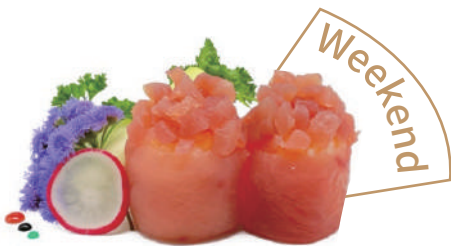
53. GUNKAN TONNO (massimo 1 porzione)