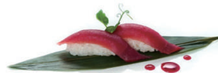
42. NIGIRI TONNO