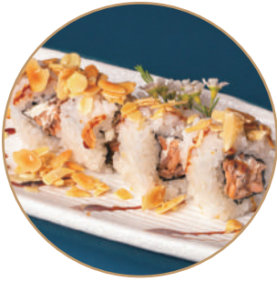
99.MIURA MANDORLE Salmone cotto,philadelphia, mandorle,teriyaki