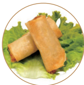
151. INVOLTINI PRIMAVERA 2pz Sfoglia di riso e verdure miste