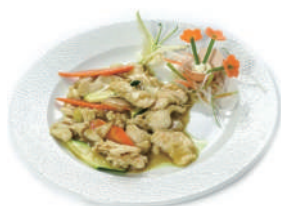
196. POLLO AL CURRY Bambu, cipolla, curry