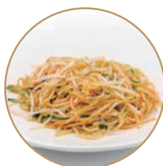
166. SPAGHETTI CON VERDURE Verdure e uova