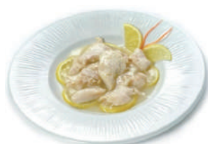
199. POLLO AL LIMONE