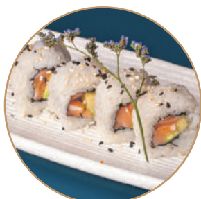
80.SAVOCADO ROLL Salmone,avocado,sesamo