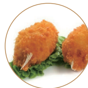
154. CHELE DI GRANCHIO* 2pz