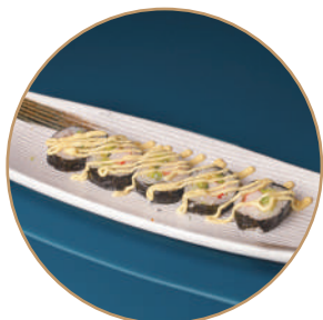
76.FUTOMAKI CALIFORNIA Surimi*, avocado, cetriolo, maiones