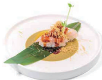
49. NIGIRI BRANZINO SCOTTATO Maionese, salsa teriyaki e kadaifi