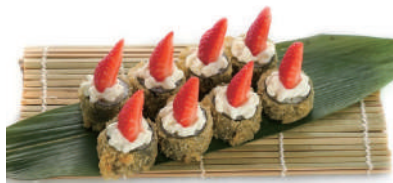
66. HOSOMAKI FRAGOLA Fritto con salmone, philadelphia, fragola, teriyaki