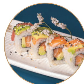
85.SAVOCADO RAINBOW Salmone,avocado, pesce misto,sesamo