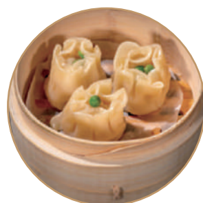
142. RAVIOLI SHAOMAI 3pz Ripieno di gamberini e carne