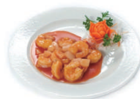
212. GAMBERI CON AGRODOLCE Peperoni e salsa agrodolce