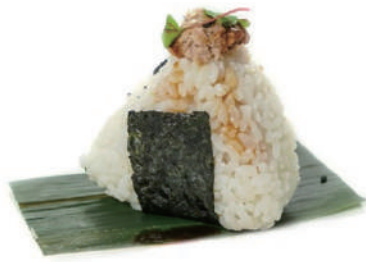
34. ONIGIRI TONNO COTTO Tonno cotto e scaglie di pesce