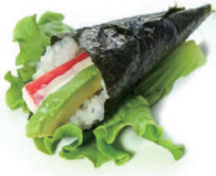
72.TEKAMI CALIFORNIA Surimi di granchio*,avocado,maionese