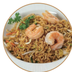
174. RAMEN SALTATI Gamberi*,verdure e salsa piccante