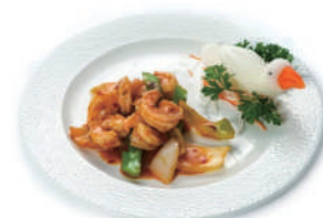
202.GAMBERI PICCANTE Peperoni, cipolla