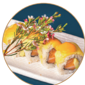
84.SAVOCADO MANGO Salmone,avocado,mango, pistacchio e salsa mango