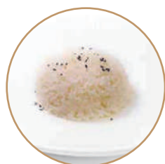
165. RISO BIANCO Riso al vapore