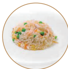
162. RISO CON GAMBERI Gamberi*, verdure e uova