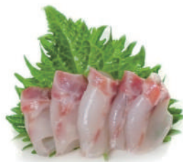
12. SASHIMI BRANZINO (massimo 2 porzione)