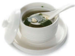
135. ZUPPA DI MISO Pasta di miso, alghe, tofu