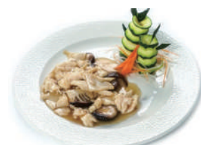
197. POLLO CON BAMBU E FUNGHI Bambu, funghi, soia