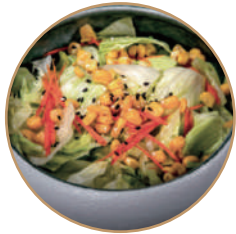
130. INSALATA MISTA Condito con salsa di sesamo