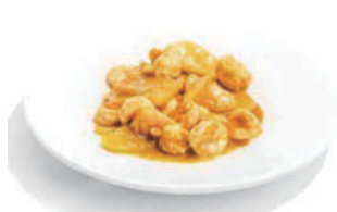
204.GAMBERI AL CURRY Bambu, cipolla