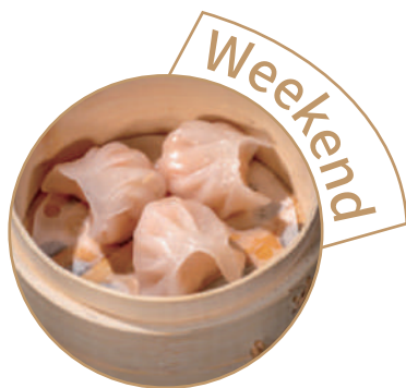
143. RAVIOLI CRISTALLO 3pz Ripieno di gamberi