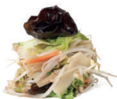
208. VERDURE MISTE