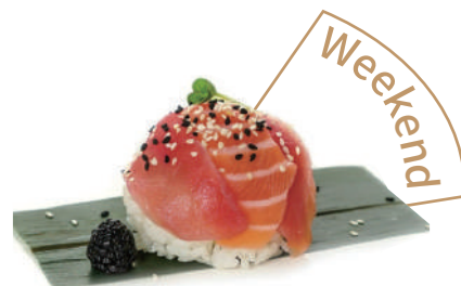
32. CHIRASHI TONNO Riso con tonno e sesamo