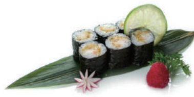
64. HOSOMAKI EBITEN Gambero* fritto,teriyaki