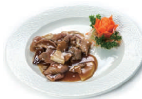
207. MANZO BAMBU E FUNGHI