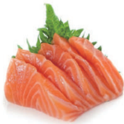
11. SASHIMI SALMONE (massimo 3 porzione)