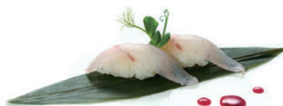
41. NIGIRI BRANZINO