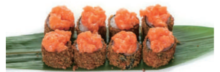
67. HOSOMAKI FRITTO Fritto con salmone,tartare salmone, kadaifi,teriyaki