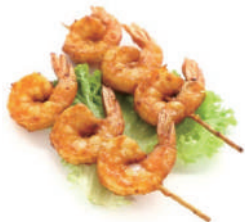
188. SPIEDINI DI GAMBERI