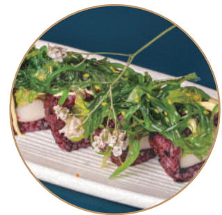
114.CALIFORNIA NERA WAKAME Surimi*,avocado,cetriolo, maionese,wakame