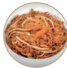
170.SPAGHETTI DI SOIA CON VERDURE Verdure e soia