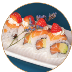
83.SAVOCADO PHILA FRAGOLA Salmone,avocado,philadelphia,fragola