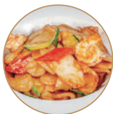
175. GNOCCHI DI RISO CON GAMBERI Gamberi*, verdure