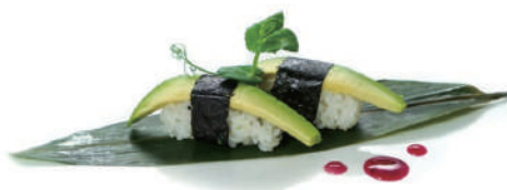
46. NIGIRI AVOCADO