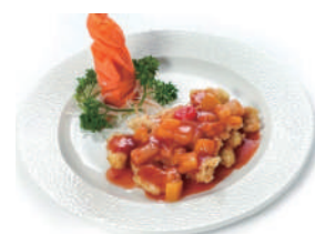
211. POLLO CON AGRODOLCE Peperoni e salsa agrodolce