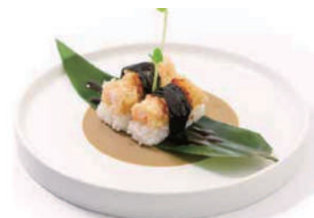
45. NIGIRI GAMBERO FRITTO Salsa teriyaki