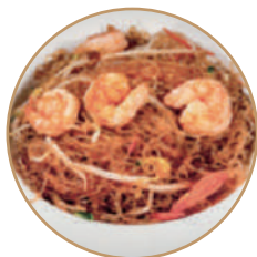
171.SPAGHETTI DI SOIA CON GAMBERI Gamberi*,verdure e soia