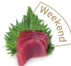
13. SASHIMI TONNO (massimo 1 porzione)