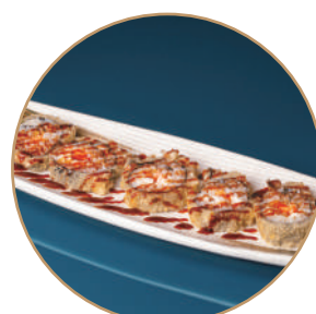
79.FUTOMAKI SAKE PHILA FRITTO Salmone,philadelphia,teriyaki