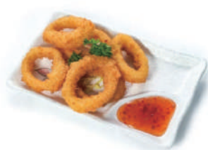
183. CALAMARI FRITTI