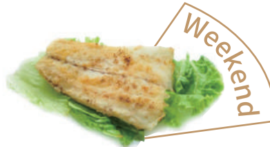
187. BRANZINO ALLA GRIGLIA (massimo 1 porzione)