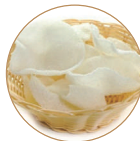
156. NUVOLETTE DI GAMBERI Chips di gamberi