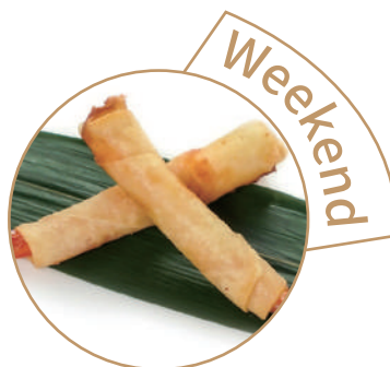
153. INVOLTINI DI GAMBERI* Sfoglia di riso e gamberi