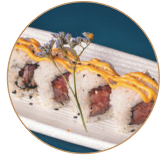
107.SPICY TUNA Tonno,sesamo,spicymaio